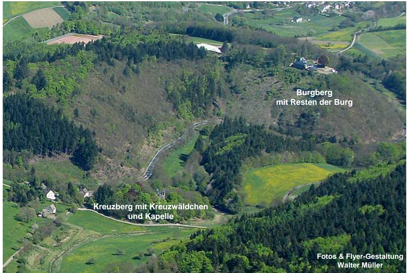
Burgberg mit Resten der Burg

Der Tod hatte den Heimkehrenden schon gezeichnet. Als er zum Sterben kam, ließ er die Tochter rufen und sprach lange mit ihr.