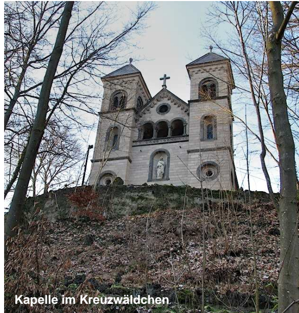
Kapelle im Kreuzwäldchen

Es ist Kreuzännchen, das im Nebelkleide klagend um den Brunnen schreiet.